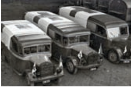
Historisches Settellen im Zweiten Weltkrieg