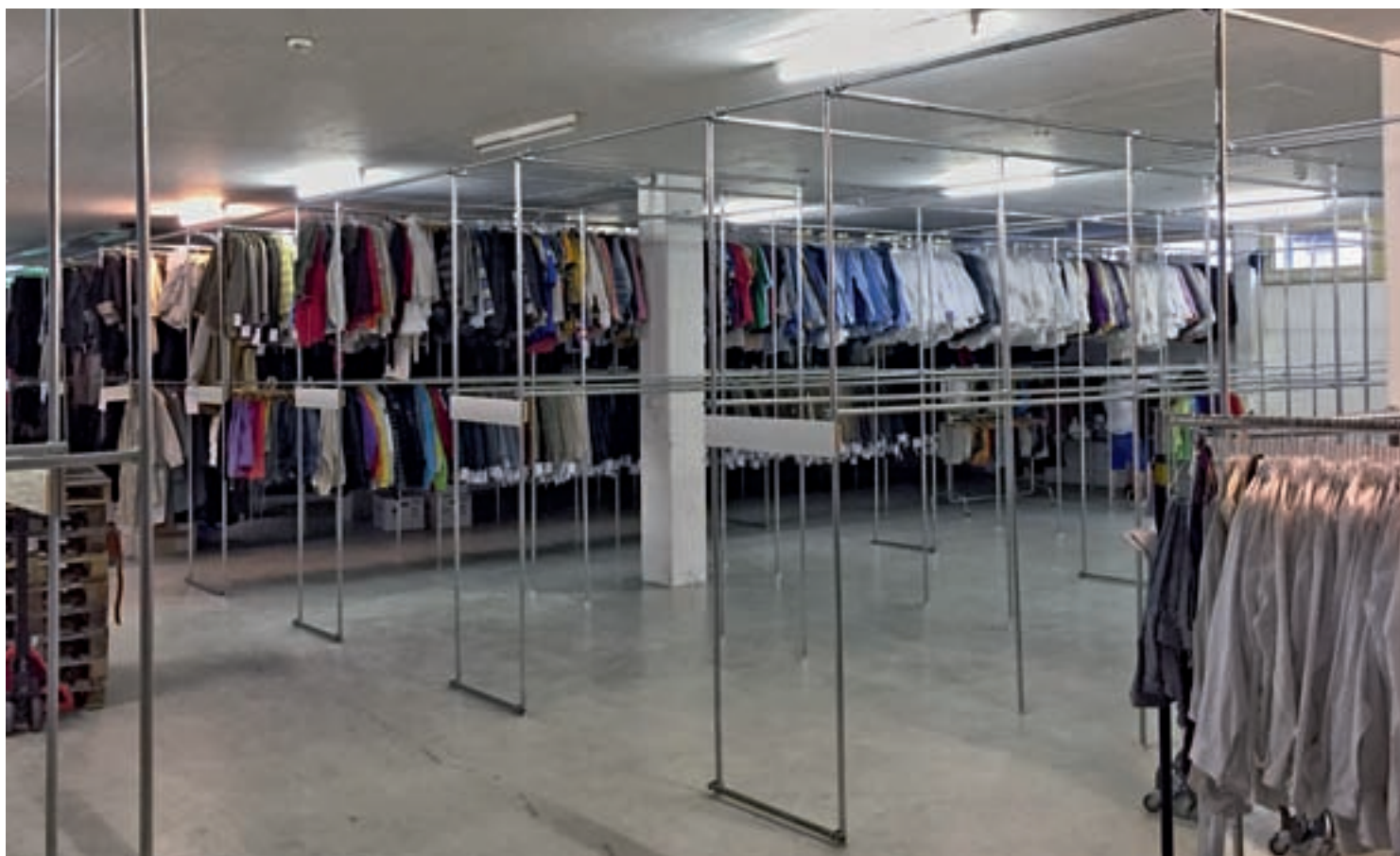
... und in einen temporären Ersatzfundus in Aesch transportiert werden.