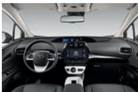
Toyota RAV Hybrid und der neue Prius