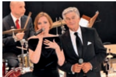
Apéro Highlights aus dem «Great American Songbook»