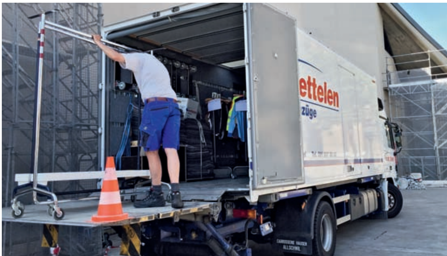
Rund 650 Laufmeter Theaterkostüme mussten verladen ...